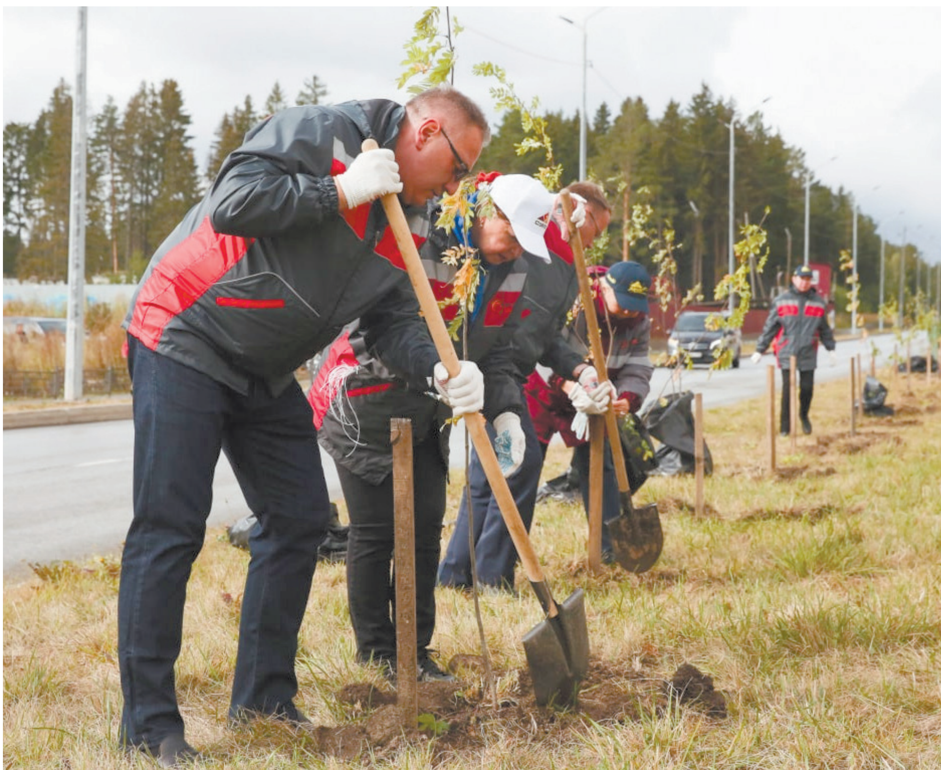
// Фото Владимира Коцюбы-Белых

В 1942 году РЗ ОЦМ начал выпуск капиллярных медных труб размером 2 x 0,55 мм