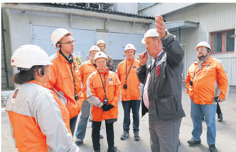
Ревдинские металлурги задали коллеге из Полевского множество вопросов, обсудили общие рабочие темы и обменялись опытом решения проблем