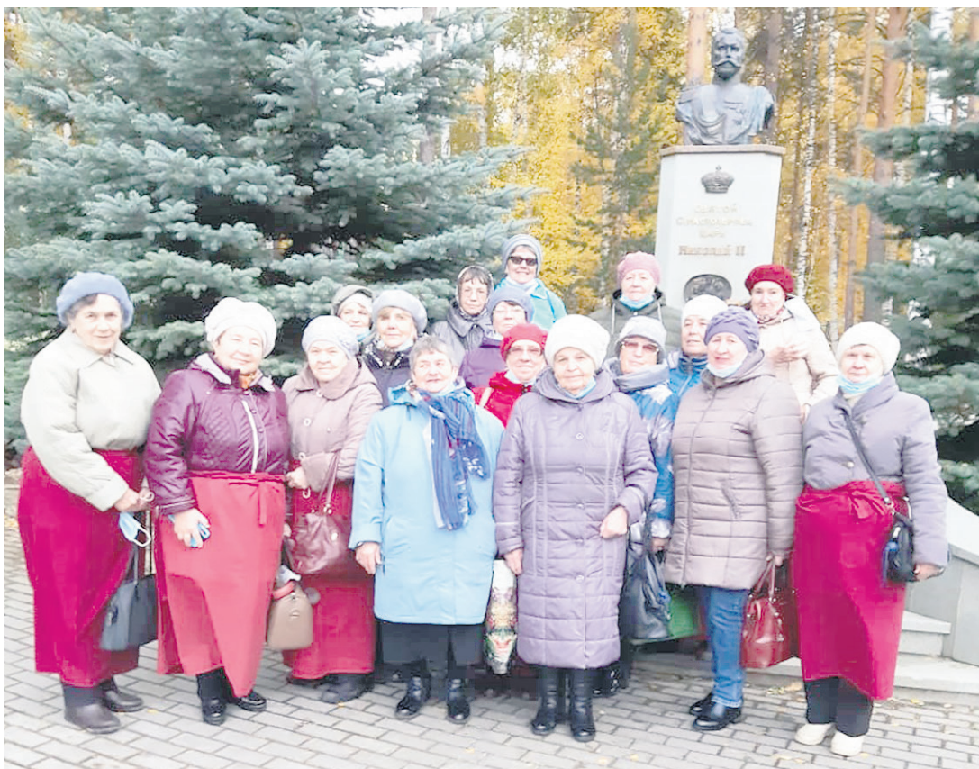
Ветераны у памятника императору Николаю II. Бронзовый бюст Царственного Стратотерпца императора Николая II был установлен 19 мая 2008 года, в день рождения государя.