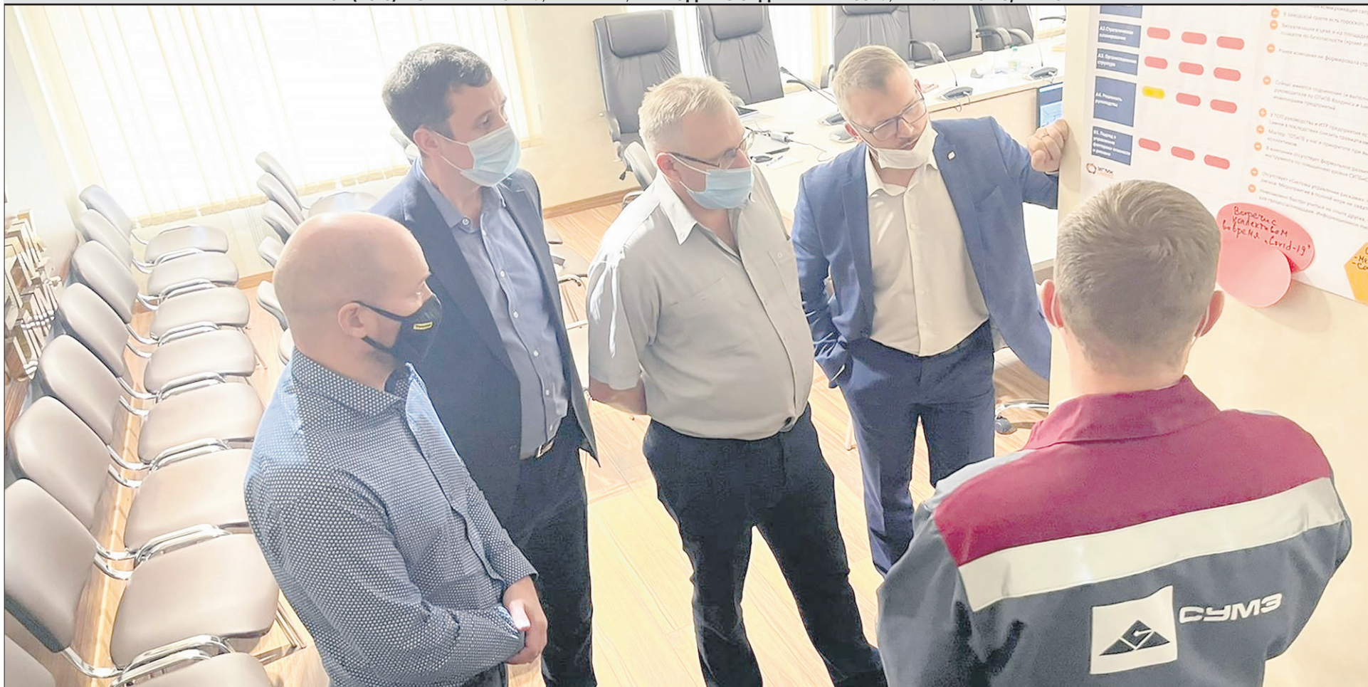
Итоговое совещание Workshop для разбора результатов экспресс-диагностики.