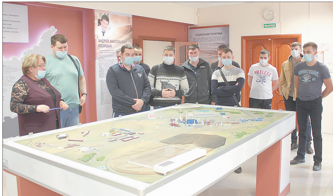
Металлурги стали первыми, кто побывал на ознакомительной экскурсии. Работники других подразделений также посетят Музей трудовой славы.

У стенда своего цеха гости поделились знаниями о подразделении с экскурсоводом, рассказали свои истории. К макетам других цехов СУМЗа металлурги проявили особый интерес, они задавали вопросы о том, как там все устроено и как работают их заводские коллеги.