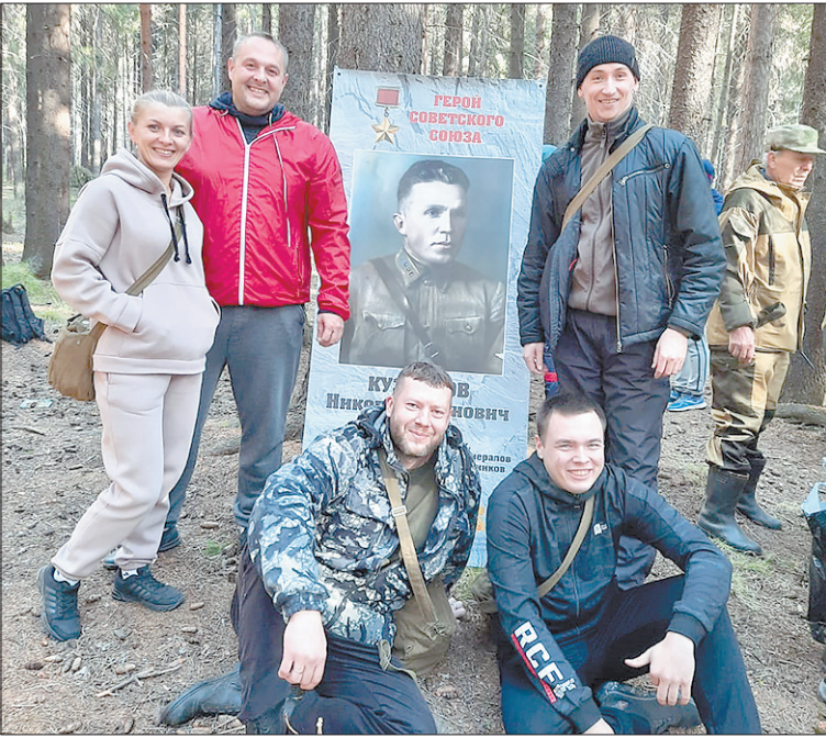
Команду СУМЗа представляли специалисты службы охраны труда и промышленной безопасности и медеплавильного цеха.