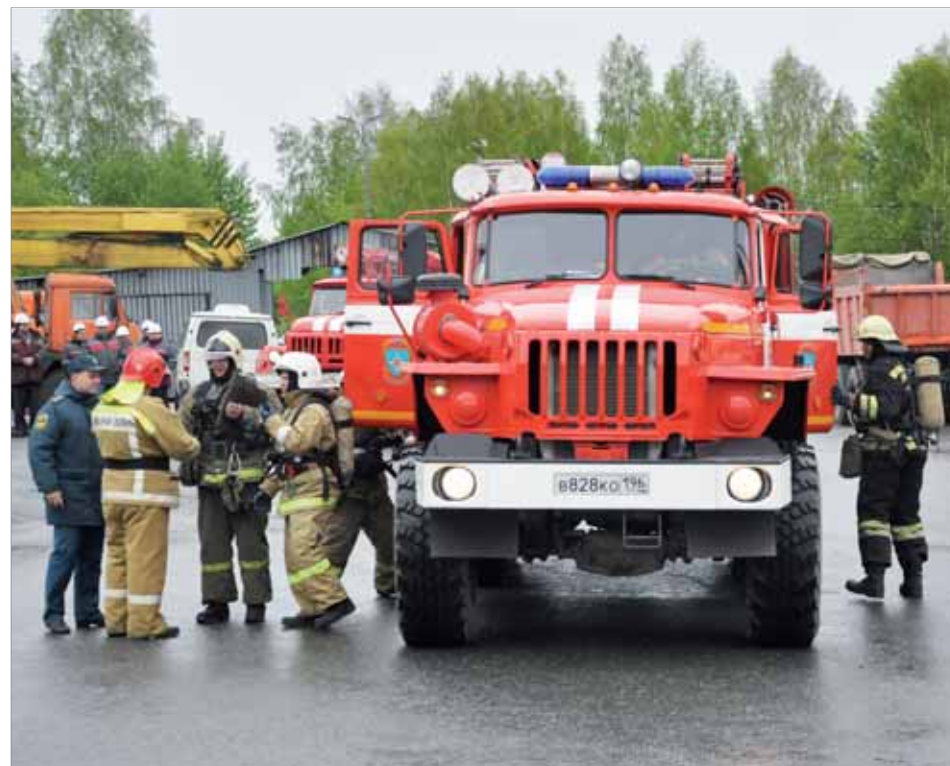
Первыми прибыли пожарные заводской службы «ПАСС». Через несколько минут им на помощь подоспели огнеборцы 65 пожарной части.

Во время ремонта в одном из гаражных боксов автотранспортного цеха загорелся грузовой автомобиль. Внутри — человек. Он уже надышался дымом и лежит без сознания. Огонь стремительно распространяется на другие автомобили. Эта легенда была придумана для проведения учений для оперативных служб завода и городской пожарной части №65.