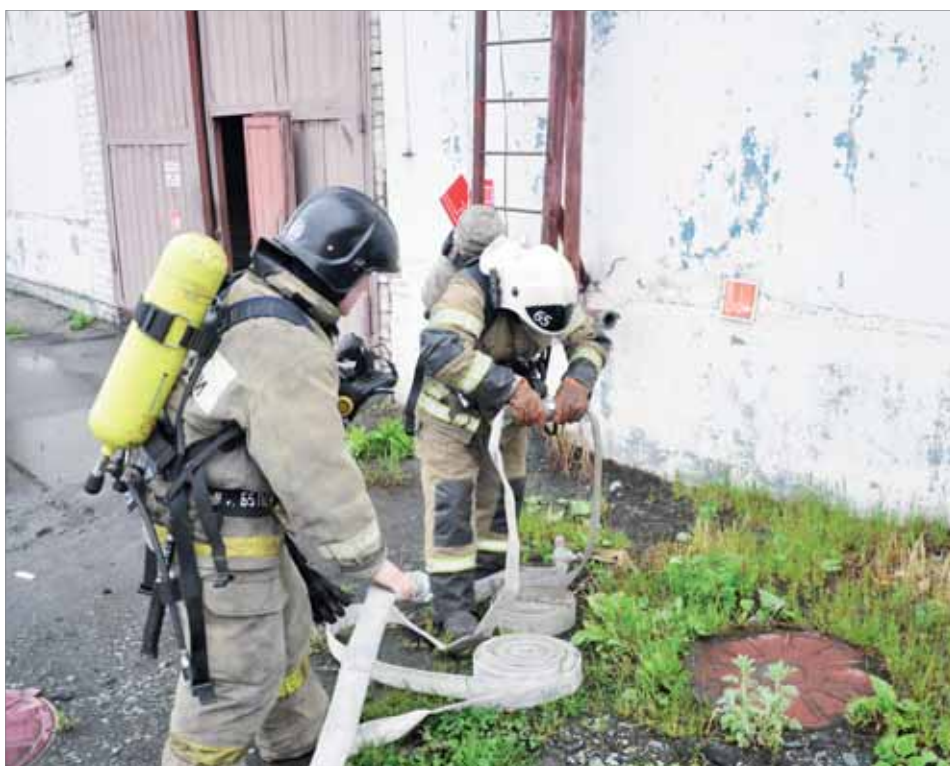
Подобные учения, в первую очередь, проводятся для того, чтобы пожарные знали, где и что располагается на территории подразделений завода.

В автотранспортном цехе прошли пожарные учения