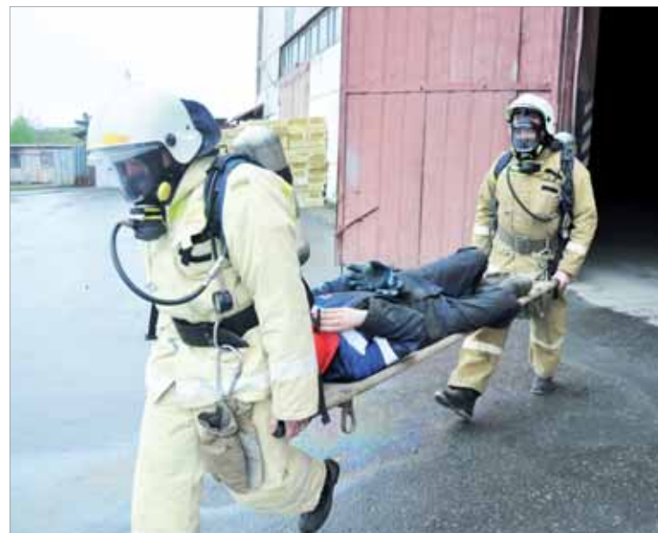
По легенде в пожаре пострадал человек. Его быстро эвакуировали и отдали в руки врачей.

Горящий «Камаз» благополучно эвакуирован из гаража. Пожар ликвидирован. На тушение ушло 24 минуты. По итогам учений комиссия вынесла вердикт — удовлетворительно.