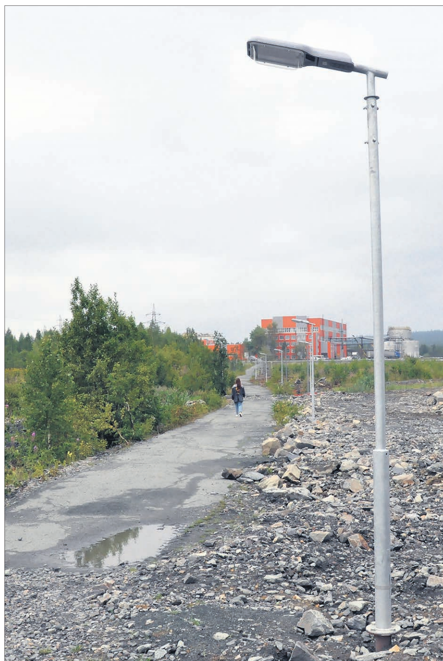
Опоры со светильниками расположены на расстоянии 25 метров друг от друга на протяжении всей пешеходной дорожки.

Новые опоры обработаны методом горячего цинкования в АО «Уралэлектромедь» и оснащены современными энергоэффективными светильниками «Виктория», которые способны работать при экстремальных температурах, служат дольше, чем обычные лампы, и значительно экономят электроэнергию.