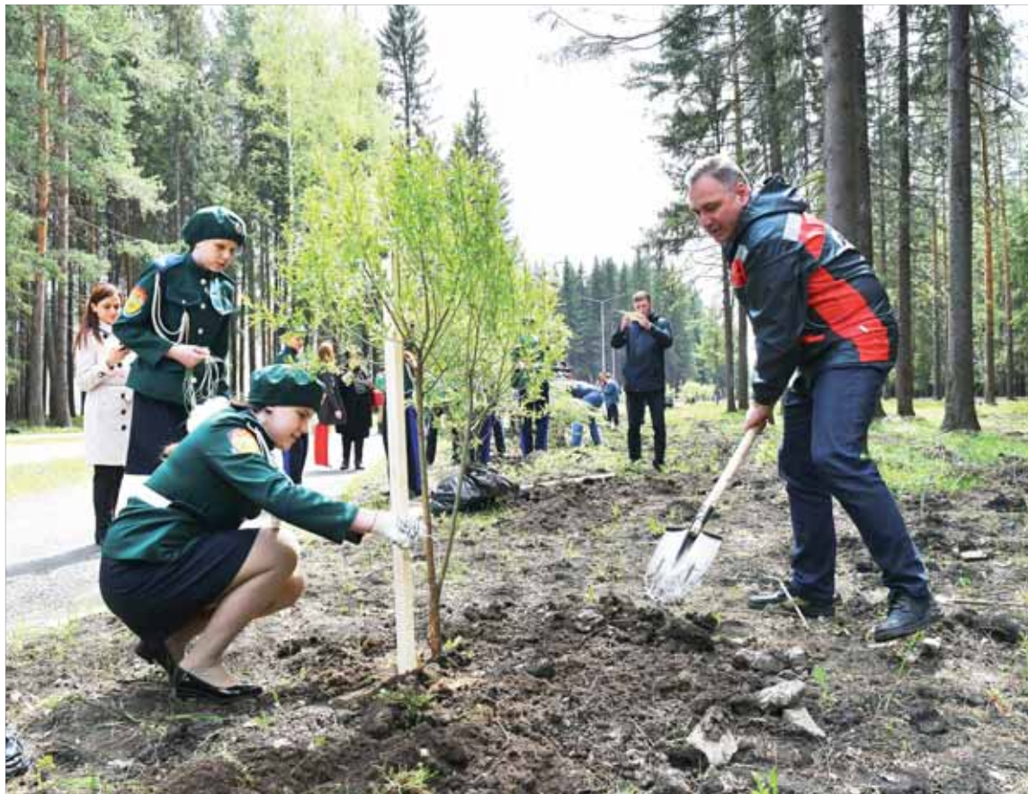
23 мая на центральной аллее ивы высадили учащиеся кадетских классов школы №1 и официальные лица.