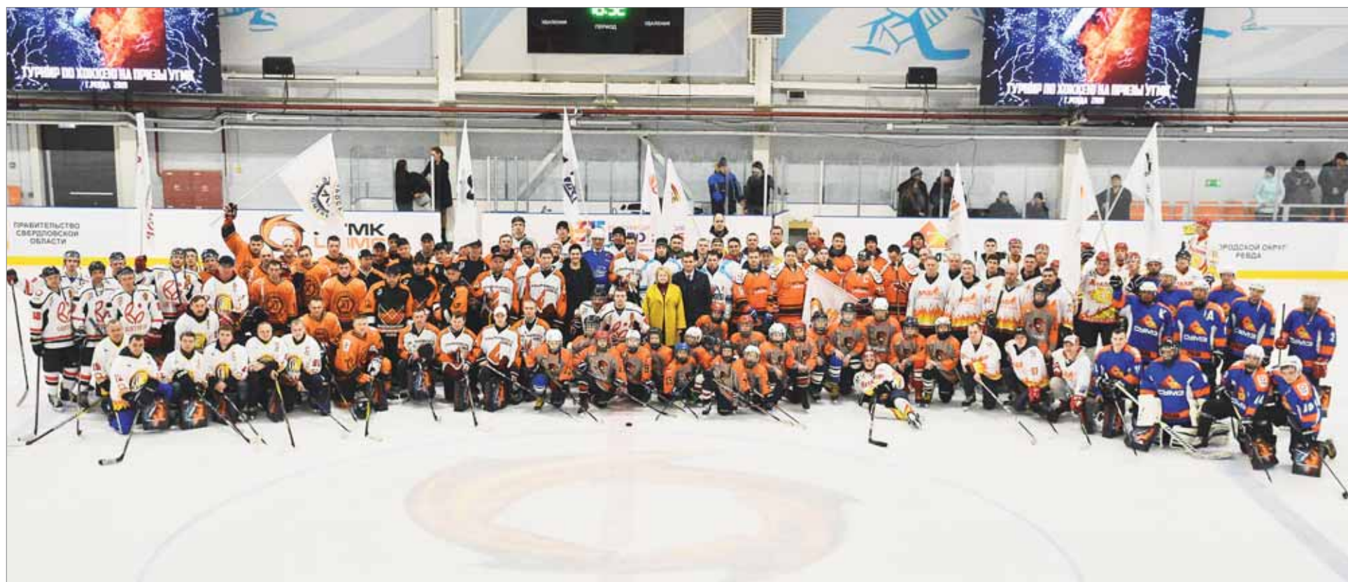
В турнире принимают участие 150 спортсменов — это 10 команд из девяти городов.

В Ревде начался традиционный турнир на призы УГМК