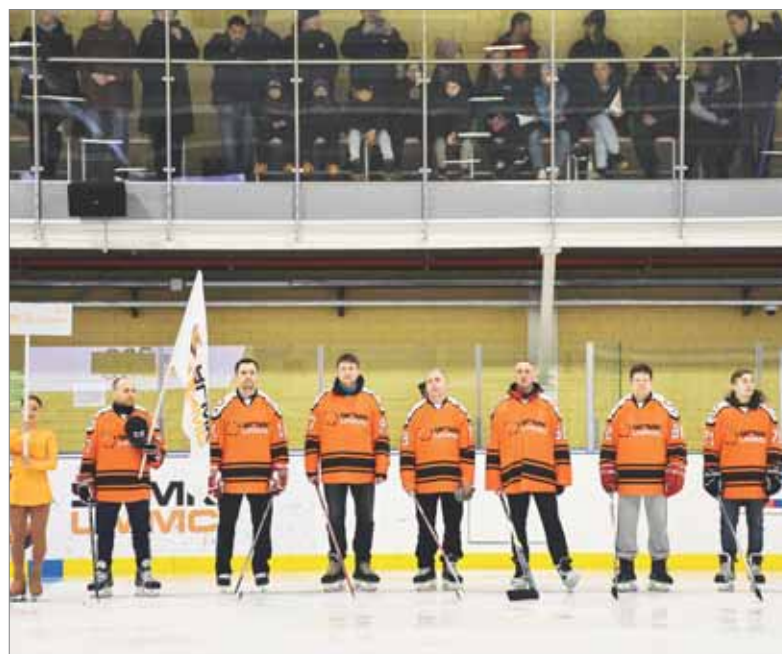
Новички турнира — команда «УГМК-Холдинг» из Верхней Пышмы. Их дебют оказался удачным — в первом матче они обыграли «Сафьяновскую медь» из Режа.