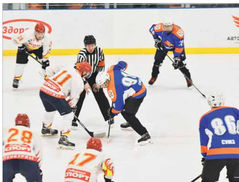
Матч между командами «СУМЗ» (Ревда) и «ММСК» (Медногорск) закончился со счетом 5:2 в пользу гостей.