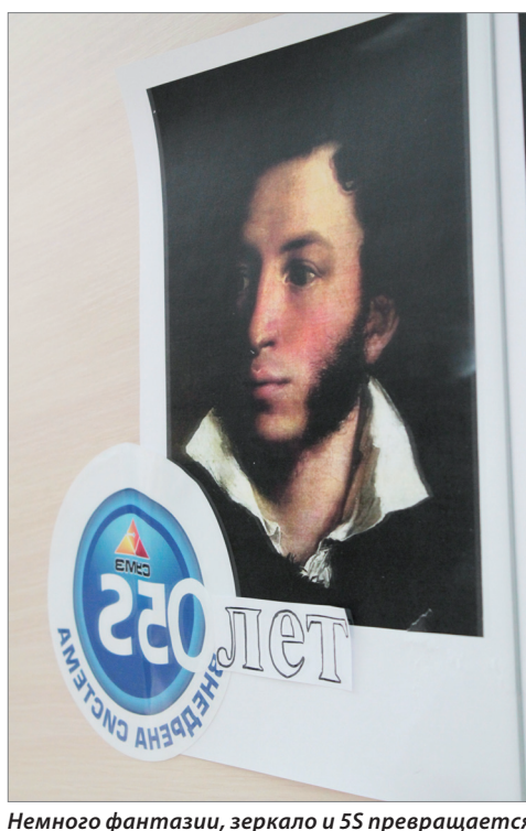
Немного фантазии, зеркало и 5S превращается в 220. Эта креативная идея принадлежит сотрудницам ОИСМ и РПС.