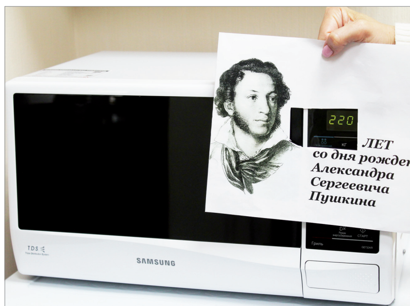
А пока разогревается еда, есть время, чтобы продекламировать любимые строки из Пушкина.