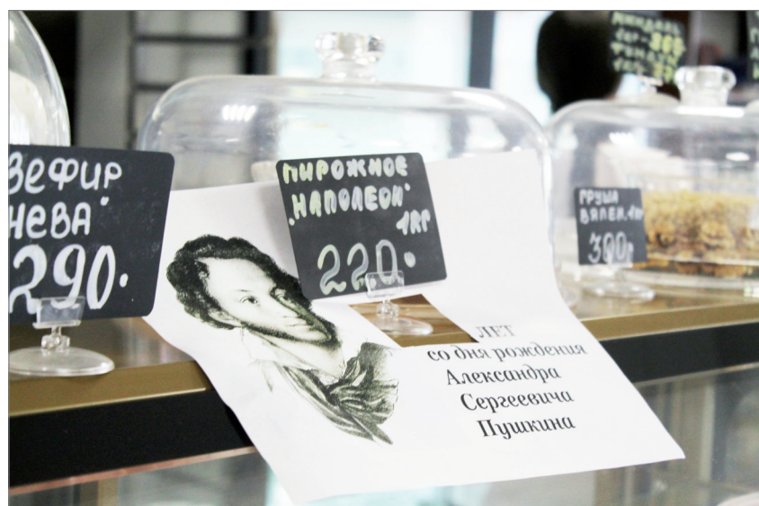
В заводском буфете не только уютно, красиво и вкусно: здесь много примет, связанных с Пушкиным.