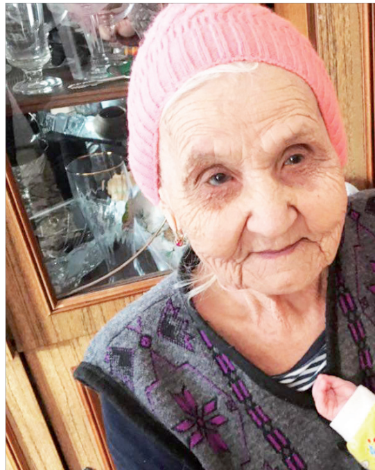
Фото из семейного архива