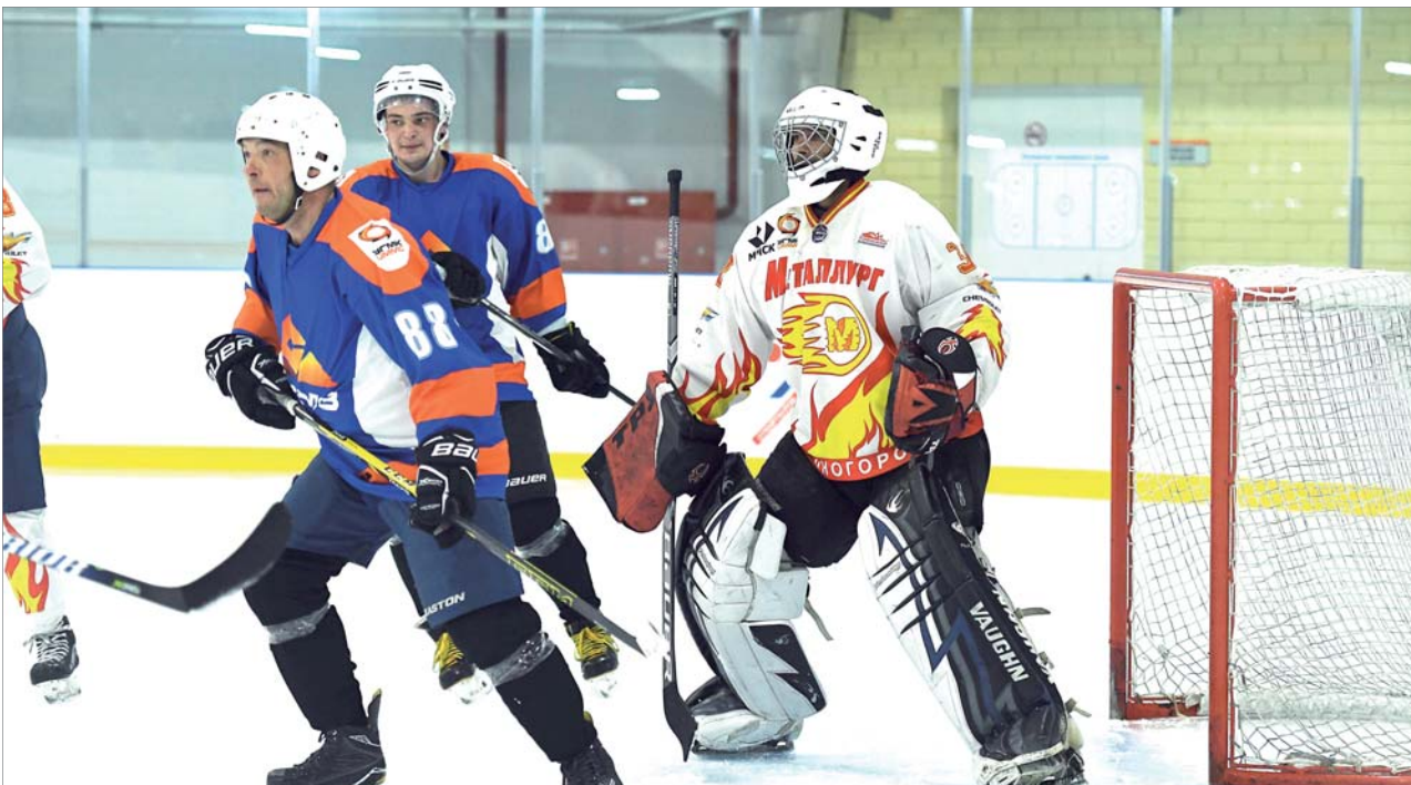
Наши хоккеисты самоотверженно боролись за каждую шайбу. Но, увы, в битве за бронзовые медали им не повезло — победу одержали соперники из Медногорска.

Наша команда «СУМЗ» по итогам ледовых баталий стала четвертой