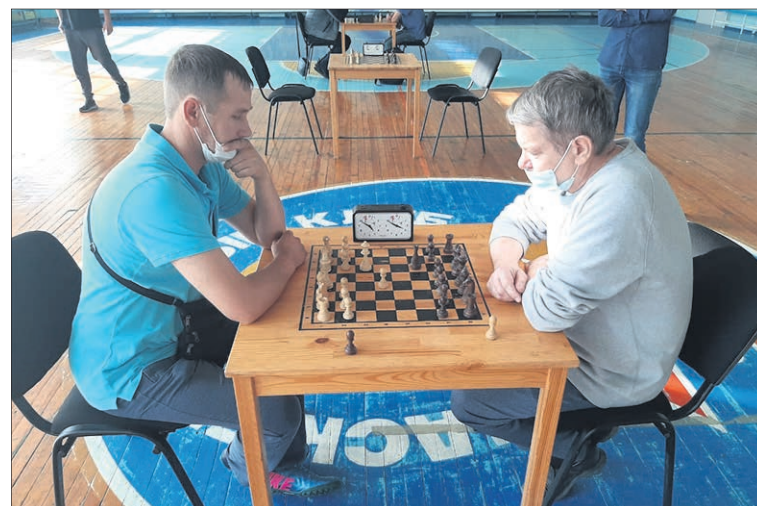
В турнире по шахматам итоги подводились в личных и групповых зачетах.