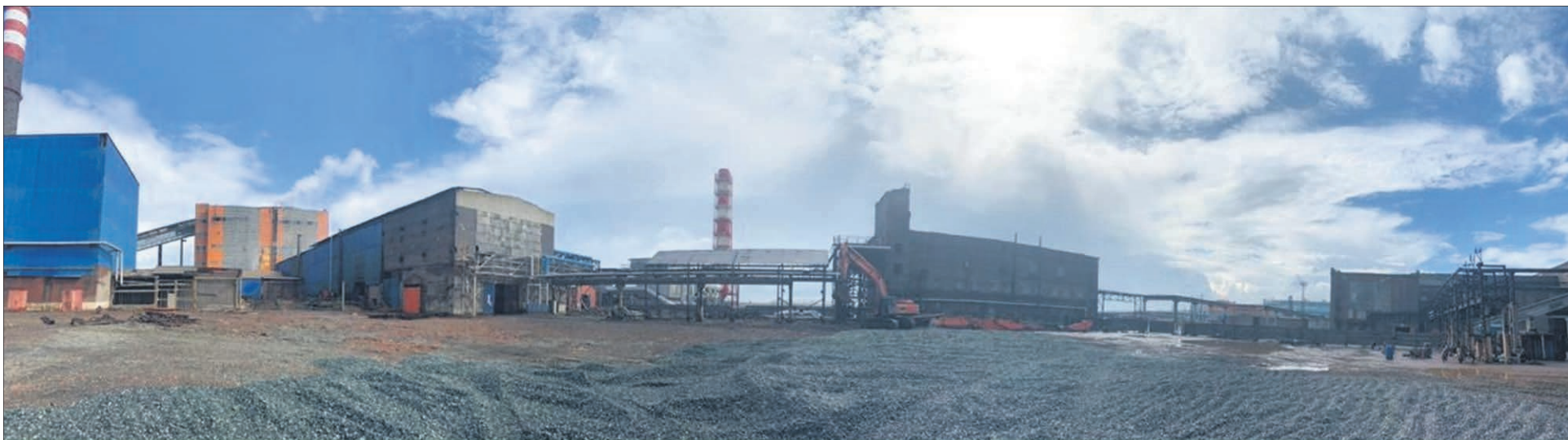
На месте ликвидированного здания отделения обжига и грануляции медеплавильного цеха проводится планировка территории и отсыпка щебнем.