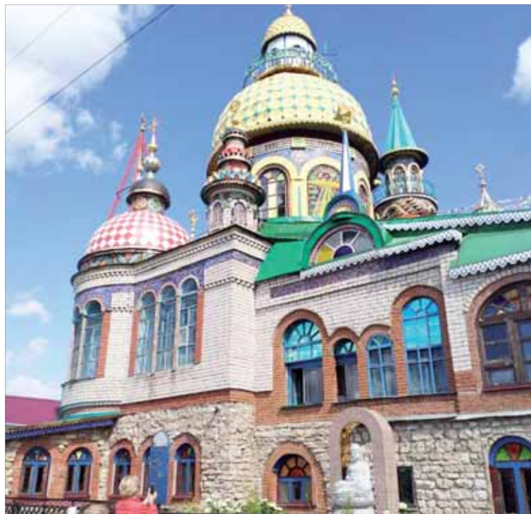
Храм всех религий.

ский кремль, говорят, он красив и днем, и ночью. А также Храм всех религий (Вселенский храм), который объединяет под своей крышей 16 вероисповеданий, как современных, например, православие, католицизм, буддизм, ислам, иудаизм, так и исчезнувших — древнеассирийскую религию.