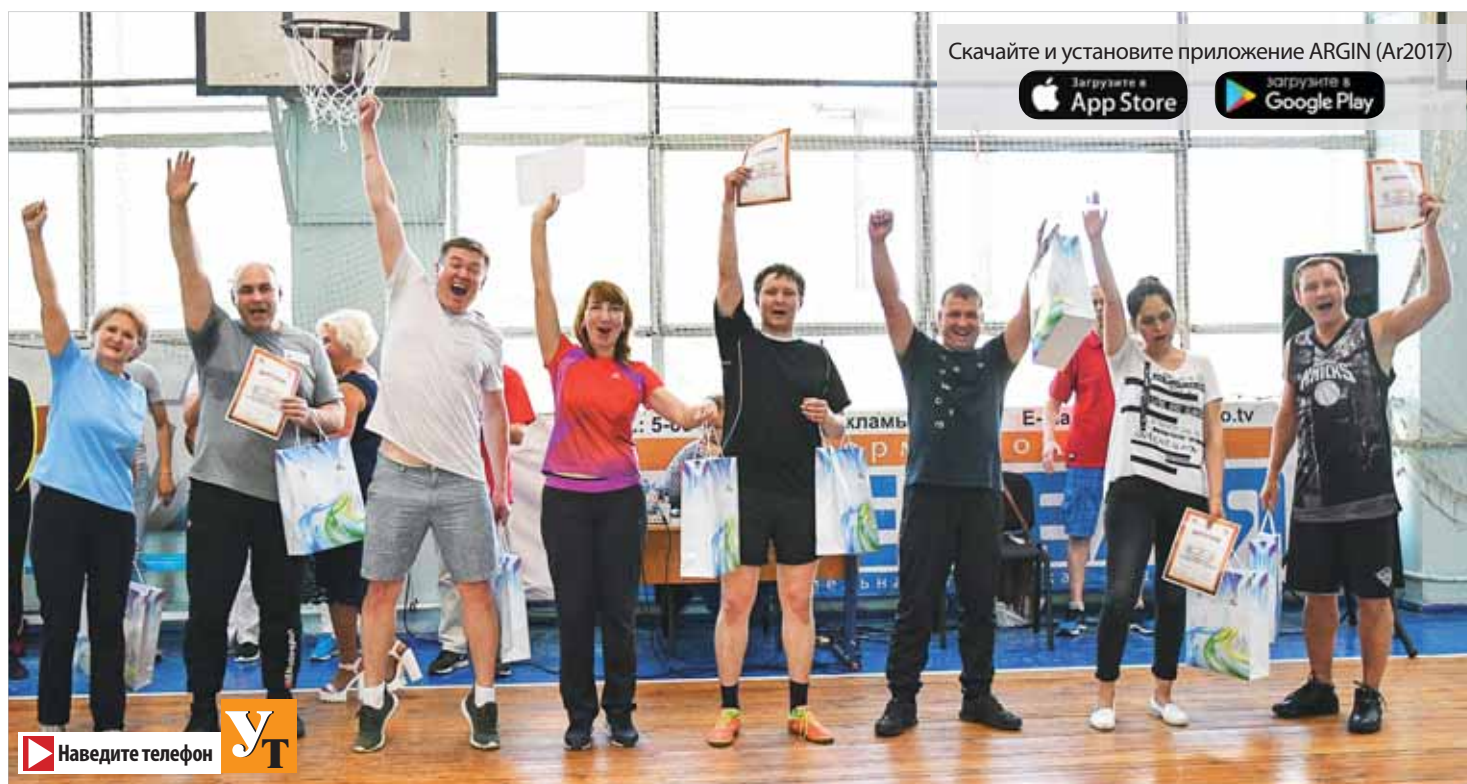
В Спартакиаде командиров производств победила команда «Метеор», которая в соответствии с названием оказалась самой быстрой и яркой.

диционной Спартакиаде командиров производств, которая была посвящена предстоящему главному празднику завода — Дню металлурга. Четыре команды — «Движки», «Кроссовки», «Метеор» и «Солнышко» — в веселых эстафетах продемонстрировали ловкость, скорость, внимание, меткость и, конечно, умение дружно работать.