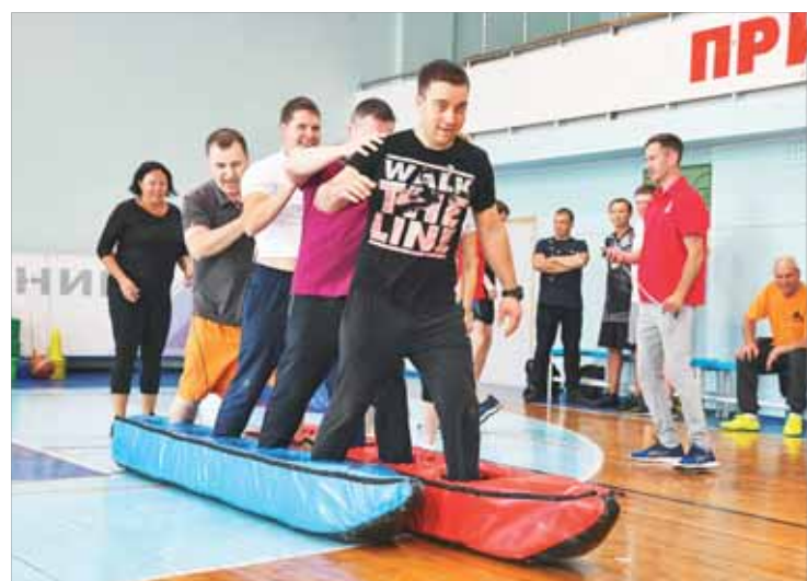
Большая заключительная эстафета. На старт лыжной гонки выходит «Солнышко».