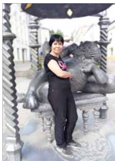
Памятник Коту Казанскому. Надпись на памятнике: «Алабрыс. Кот казанский: ум астраханский, разум сибирский...» На фото Наталия Иванчикова.

яжском Богородице-Успенском мужском монастыре и Свяжском Иоанно-Предтеченском женском монастыре, находящемся на острове Свяжск. Там же расположена Троицкая церковь — единственный в Поволжье памятник деревянного зодчества, сохранившийся еще со времен Ивана Грозного. В Казани 52 православных храма и собо-